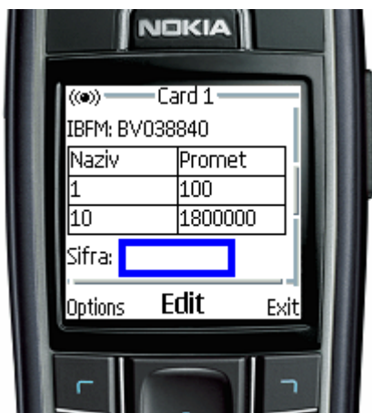
Slika 6 – Osnovna WAP strana aplikacije

Spark je po prijemu konekcije prepoznao da se radi o konekciji koja dolazi sa mobilnog telefona. Učitavajući statičku stranicu iz memorije, statički sadržaj na mestu odgovarajućih tag-ova je zamenjen odgovarajućim dinamičkim koji je pročitao preko serijskog porta iz kase.