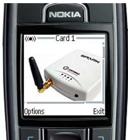
Slika 8 – Slika na displeju telefona je poslata sa Sparka, a prikazana na browser-u mobilnog telefona

U prikazanom primeru uspešno se prenosi i jedna slika, čiji format i veličina zavisi od toga da li se prikazuje u WEB ili WAP browser-u. Ovaj prenos slike ilustruje mogućnost da se slika pročita sa serijskog porta nekog uređaja koji bi je generisao (npr. neka kamera) i prenese tu sliku korisniku na njegov zahtev bilo na PC, bilo na mobilni telefon.