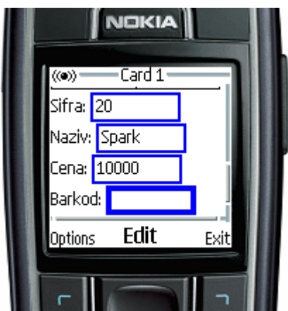
Slika 7 – Unešeni podaci za izmenu baze artikala na kasi sa mobilnog telefona

Na ovoj osnovnoj strani se nalazi i formular za ažuriranje baze artikala u kasi, pa njegovim popunjavanjem i biranjem dugmeta "Unesi", odgovarajući podaci se prenose Sparku POST metodom.